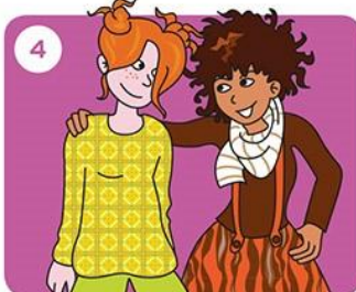
Stap naar je maatje of jouw maatje stapt naar jou.