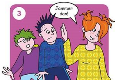
Ga iets anders doen.