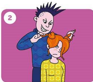
Gaat het door?