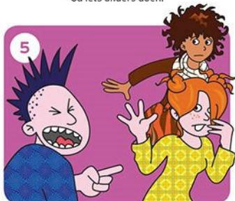
Gaat het door?