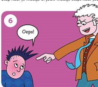
Ga naar je juf of meester. Die grijpt in.