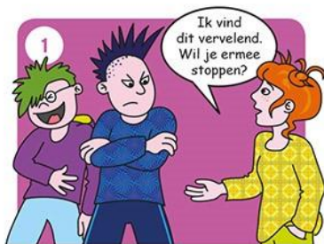
Zeg dat je het niet leuk vindt.